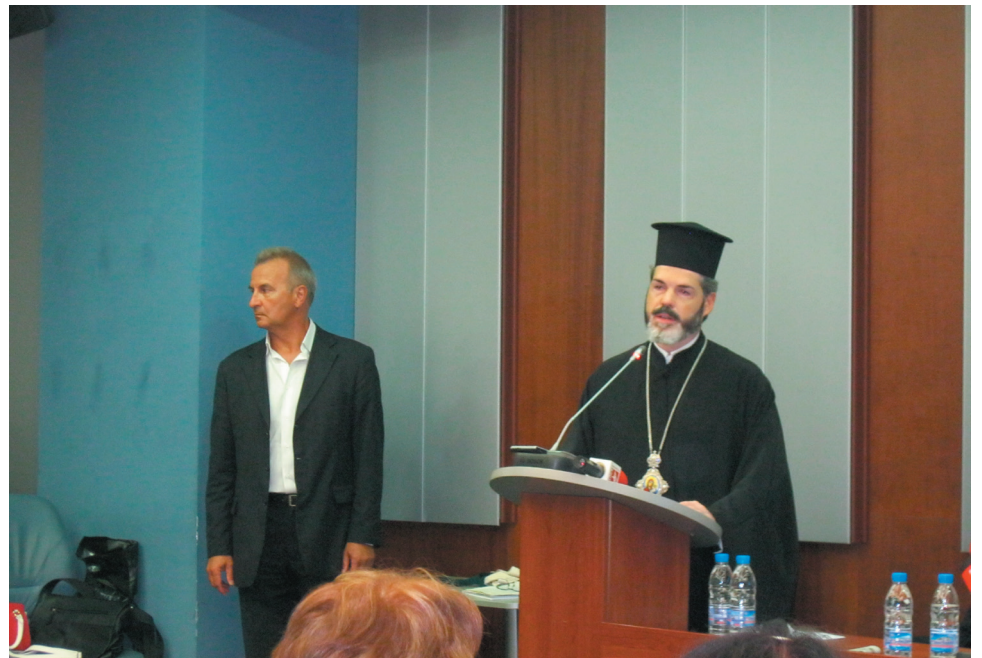
Западноевропейският митрополит Антоний на срещата на АБУЧ в Софийския Университет „Климент Охридски“

Отдел „Връзки с обществеността“ при Св. Синод на БПЦ