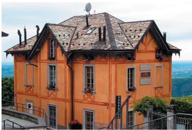
Хотел „Bella Vista“ в Брунате, където издъхва Славейков

В началото на 1912 г. Славейков получава известие от Швеция, че е предложен за Нобелова награда за литература от Алфред Йенсен. Получава обаче и друго съобщение от родината – пенсията му спира да пристига. Здравето на Пенчо започва да се влошава и да тревожи близките му. Измъчва го и безпокойството да завърши своята грандиозна „Кървава песен“. Лекарите го съветват да отиде на планина. Пенчо и Мара решават да заминат в Брунате при Лаго ди Комо. На 5 юни се настаняват в скромна стаичка на хотел „Bella Vista“.