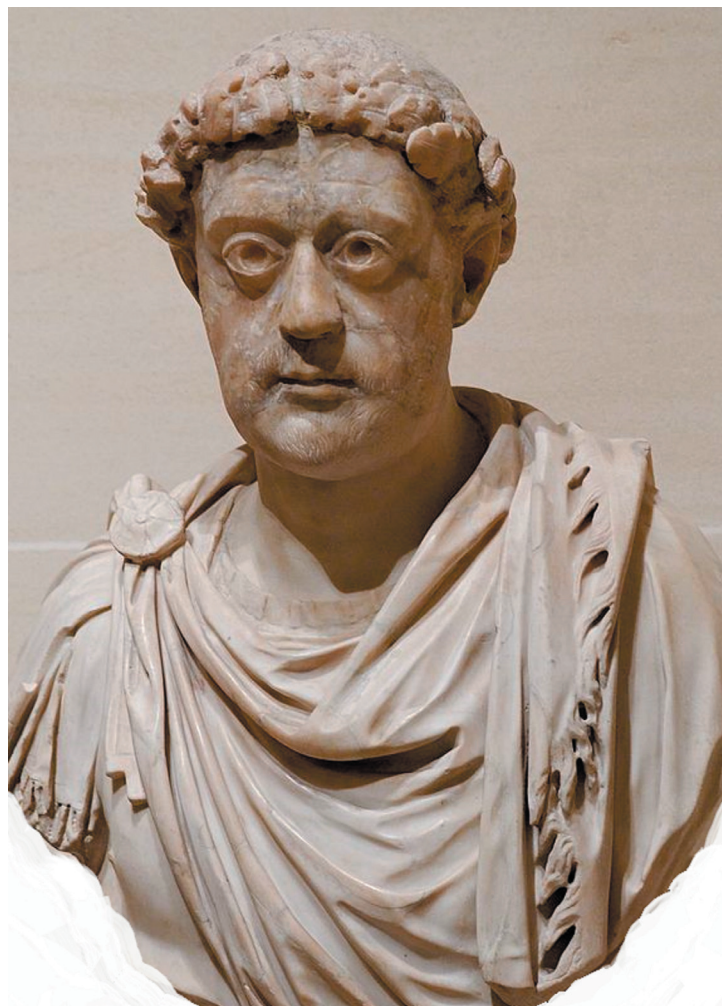
Лъв I Тракиец - Мраморен бюст - Лурвър - Париж