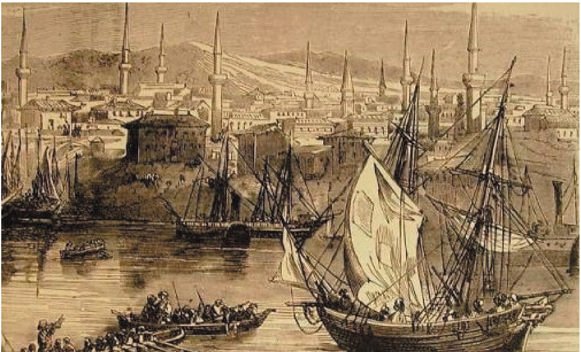
Гравюра на Русе от 1876 год.